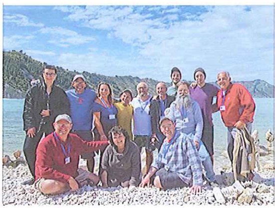
BAWI 2013 - Massa Lubrense 13 - 20 ottobre 2013

L'evento BAWI 2013 Italy – Massa Lubrense rappresenta una buona occasione per far conoscere ad un pubblico nazionale ed internazionale una forma d'arte che vede nella meditazione, nel silenzio e nel valore del momento la sua ragion d'essere.